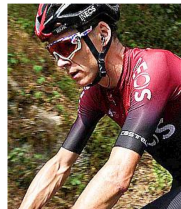
Chris Froome ne sera pas sur le Tour de France 2020.

Un peu plus d'un an après sa grave chute sur le Dauphiné 2019 qui l'avait laissé perclus de fractures (vertèbre cervicale, fémur, hanche, coude, côtes...), le Britannique Froome, en partance la saison prochaine vers l'équipe Israël Start-Up nation, n'a pas réussi à convaincre